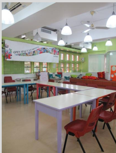
「學校電子學習試驗計劃」主力支援英語教學，上圖為K-Zone（英語學習室），現已安裝Aruba AP，以提昇電子學習效果。

再者，短短的一節上課時間是非常珍貴的；為加強課堂的互動及效益，當務之急就是提昇校園的無線網絡。